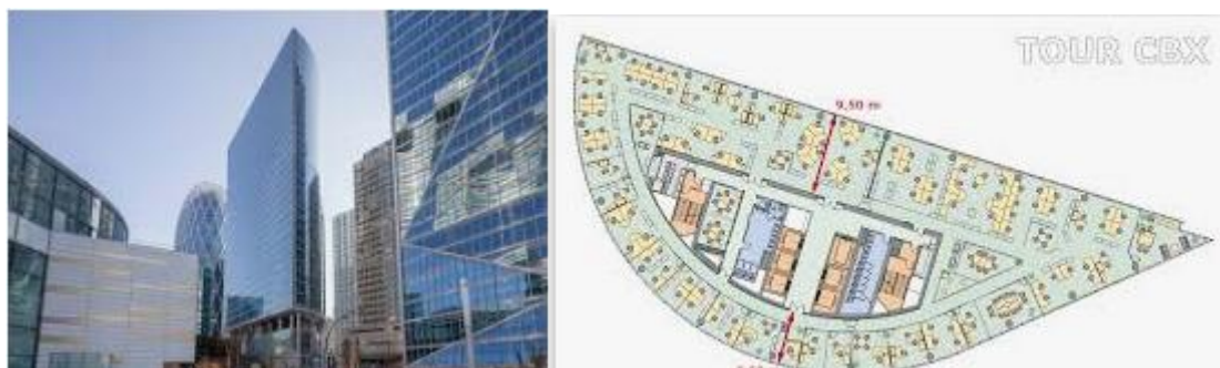
Réalisation de plateau de bureau à la Tour CBX - Paris