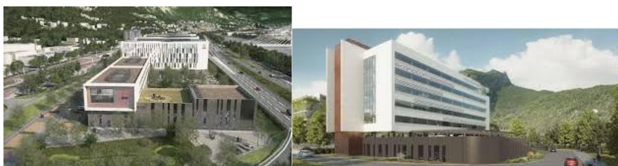
Pôle Hydraulique de Saint Martin le Vieux -EDF

MV BAT s'est forgé une expérience également sur des régions autres que la Région Parisienne. Nos personnels savent gérer l'ensemble d'un chantier en province la logistique est là et Ils demeurent en relation constante pour des conseils et le suivi des affaires.