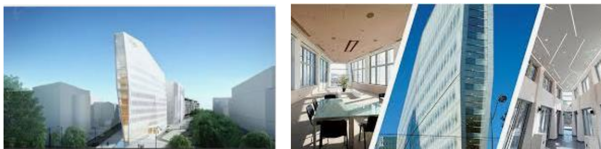
Réalisation de plateau de bureau bâtiment TRIGONE – siège COLAS