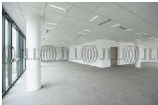
Exemple de réalisation de plateau de bureau