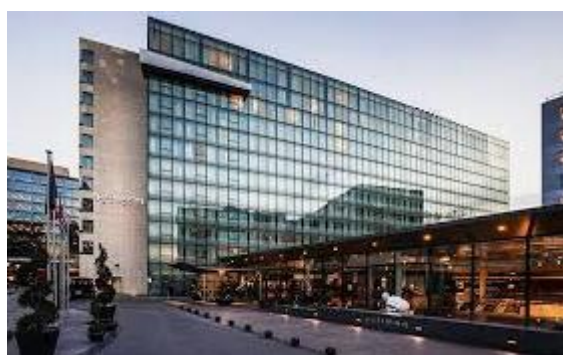
Réalisation de de la zone piscine et SPA.