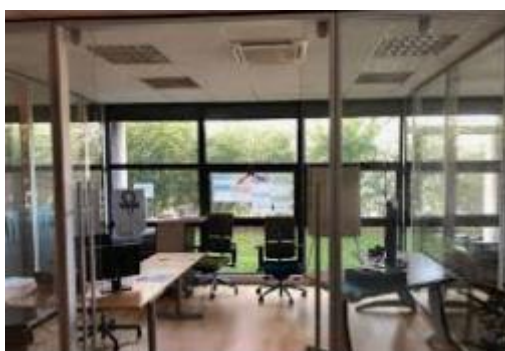
Aménagement de bureaux avec cloisons / peinture / revêtement de sol – IMMEUBLE SXB1- STRASBOURG